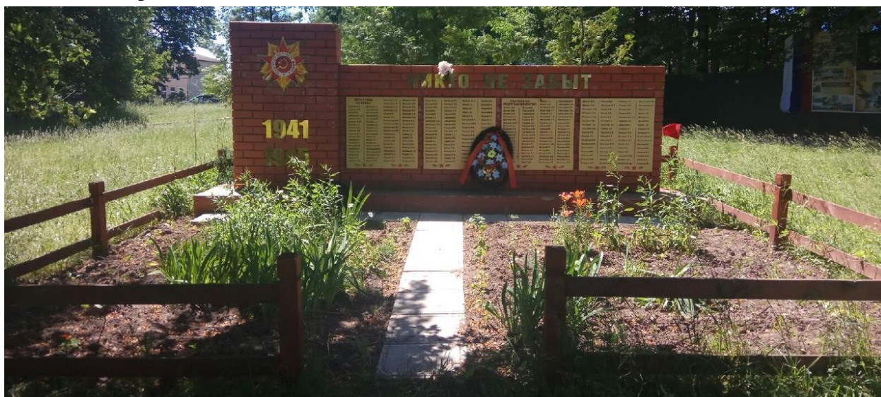
Фото на фоне памятника.