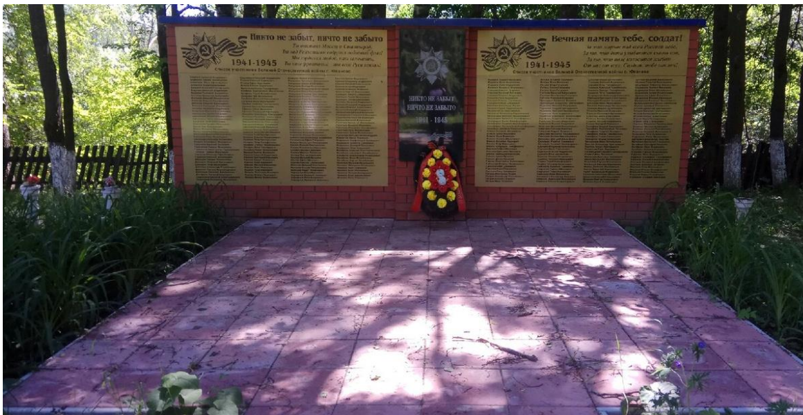
Фото на фоне памятника.