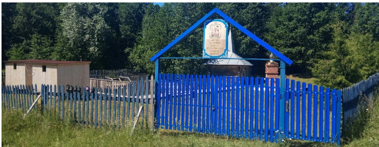
Фото у источника.