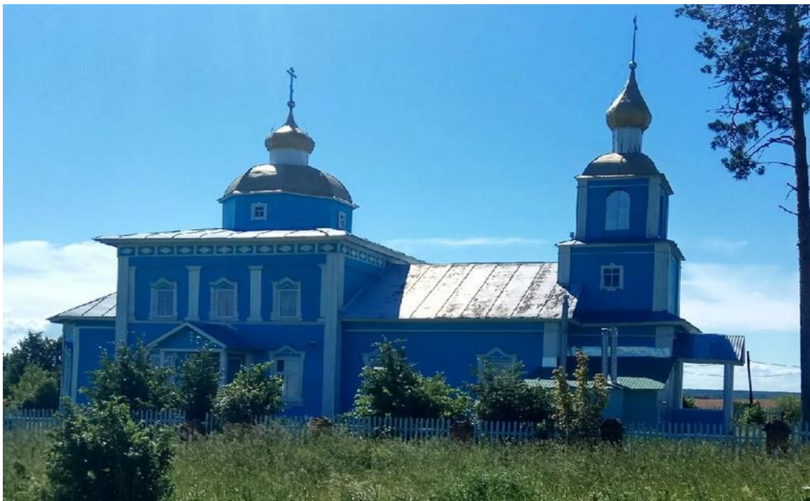
Фото на фоне церкви.