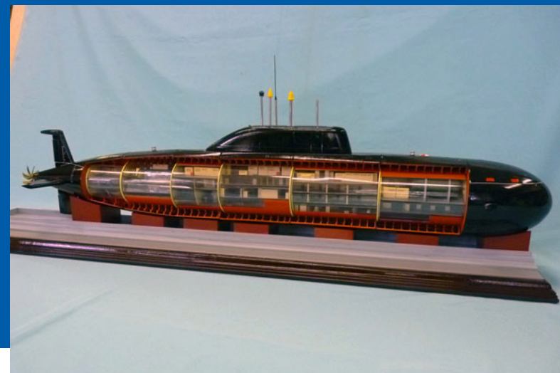
Северодвинский городской краеведческий музей