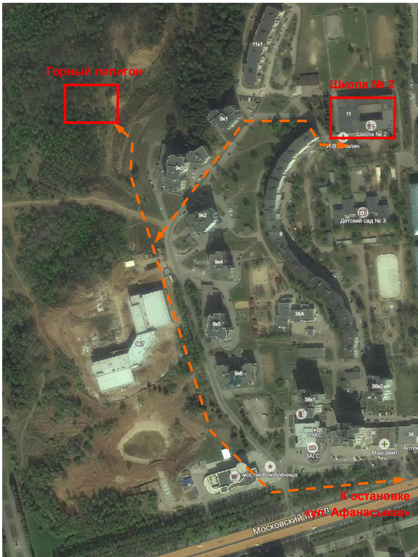
Приложение 1 к Информационному бюллетеню. Схема расположения горного полигона